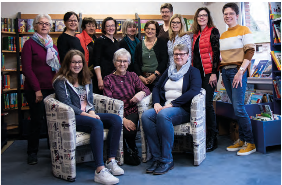
18 ehrenamtliche Mitarbeiter kümmern sich um den Büchereialltag und organisieren Buchausstellungen, Buchflohmärkte und die Aktion „Bibfit“.