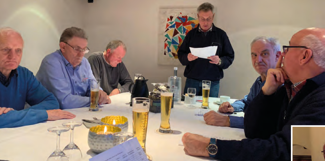
Jahresversammlung der Ü60-Fußballer in der Gaststätte Breil-Klause.