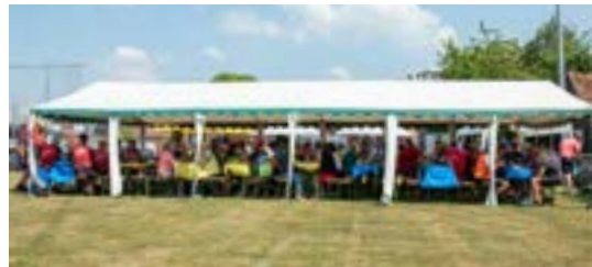
16 Uhr am Sportplatz...

Die Strecke war ein Genuss fürs Auge und eine Top-Abwechslung zu den Touren, die einem sonst angeboten werden. Und die Mantaplatte und das Weizenbier danach machten meine erste CTF-Tour zu einer absolut runden Sache, die ich nächstes Jahr auf jeden Fall wiederholen werde. Eine echte Empfehlung.