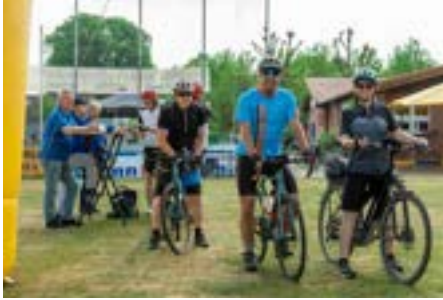
10 Uhr am Sportplatz. Um 6 Uhr ging es los. Noch herrscht gähnende Leere unterm Pavillion.