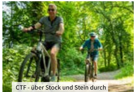
CTF - über Stock und Stein durch Wald und Flur.

Weiter geht es über Stock und Stein, problemlos befahrbar, durch schattenspendende Wälder und entlang an Wiesen und Weiden bis zur nächsten Verpflegungsstation am Hof Storksberger. Mehr als zwei Drittel des Wegs sind geschafft. Die letzte Etappe führt über einige Wege, die ich noch nie gefahren bin, dabei wohne ich nur wenige Kilometer entfernt. Ein großes Lob an die Streckenfinder des Herberner Veloteams. Wieder am Rasenplatz angekommen, sind sich alle einig: Das war echtes Genussradeln.