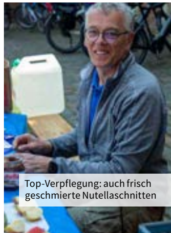
Top-Verpflegung: auch frisch geschmierte Nutellaschnitten