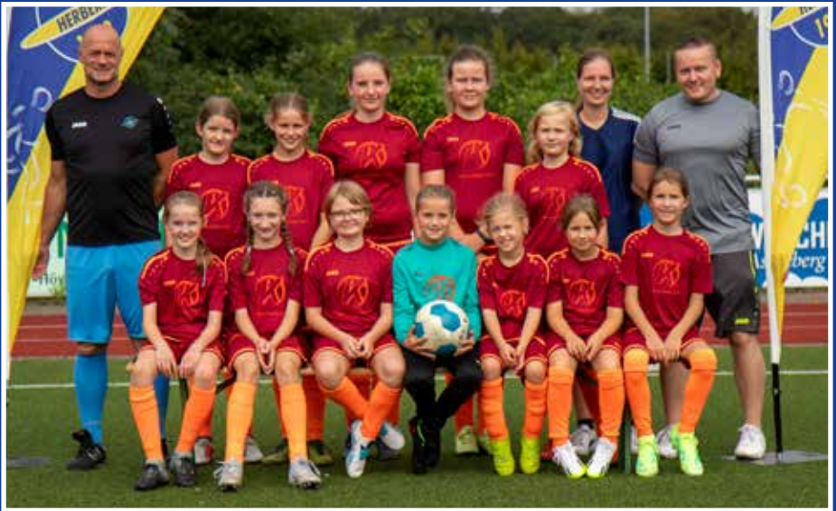
D-Mädchen (D-Juniorinnen U12/U13) Jahrgänge 2011 und 2012